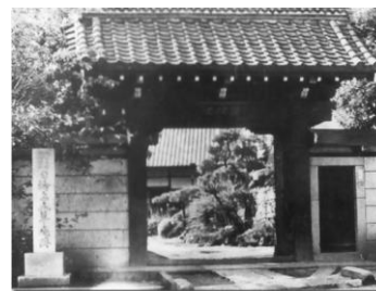
学校の開かれた理境院