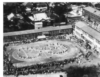
昭和29年大運動会（木造校舎時代）