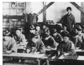
明治のころの授業（家庭科）